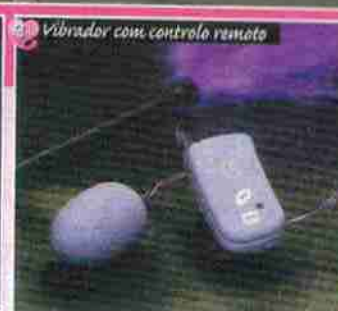
Vibrador com controlo remoto